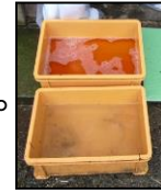
推奨される踏込消毒槽の設置方法！