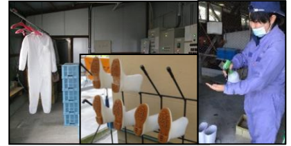
専用の服や靴の使用、手指消毒