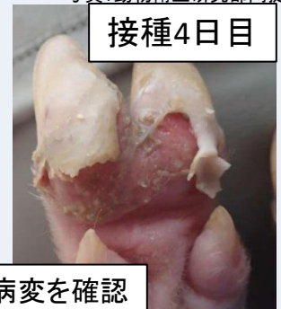
多数の水疱病変を確認

➡ 毎日必ず健康観察 し、これらの症状を見つけ次第、直ちに 獣医師 や最寄りの 家畜保健衛生所 に 連絡 しましょう。