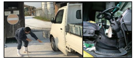
車両はタイヤだけでなく、 泥よけの内側まで消毒 し、 フロアマットの交換 や ペダル等車内も消毒