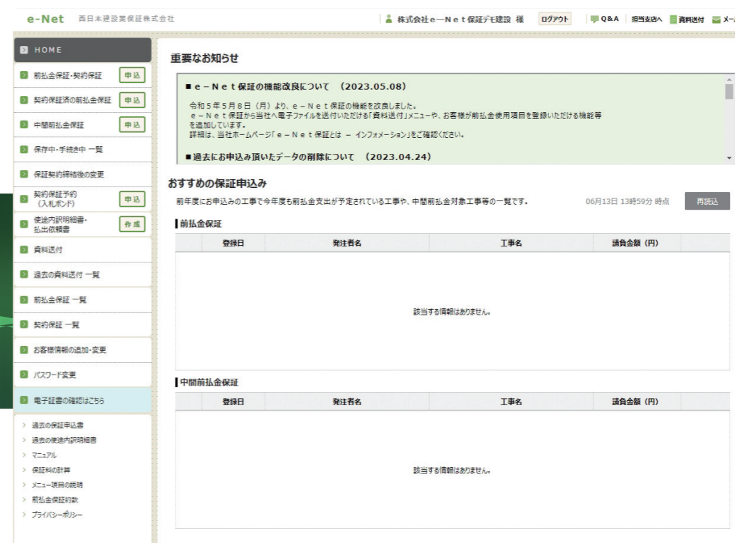
< HOME 画面 >