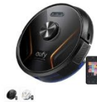
Eufy RoboVac X8 Hybrid カラー：ブラック、ホワイト