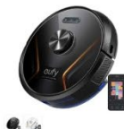
Eufy RoboVac X8 Hybrid カラー：ブラック、ホワイト