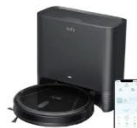
Eufy Clean G40 Hybrid+ カラー：ブラック