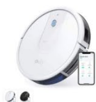
Eufy RoboVac 15C カラー：ホワイト、ブラック

https://www.ankerjapan.com/pages/robovac-support