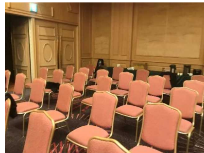
サプライヤー控え場所写真