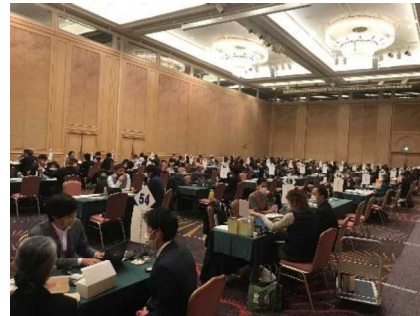
商談テーブル写真