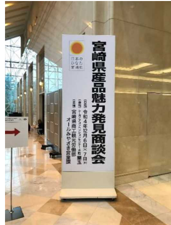
コンベンションセンター 2F 実施案内看板