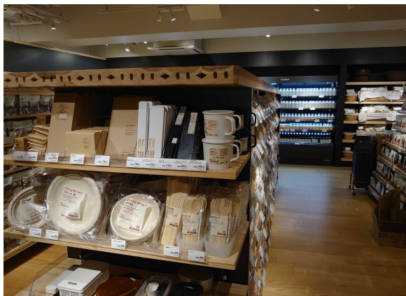
(内装木質化・木製調度品の導入)