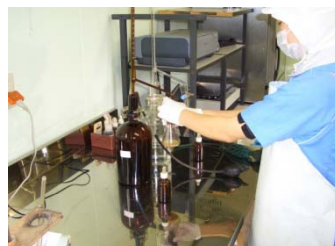
③袋詰め前のロット検査 (すべての商品)