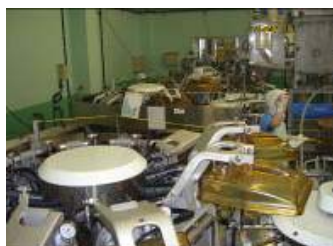
⑤厳しいチェックの後、最新鋭の機械で袋詰めされる