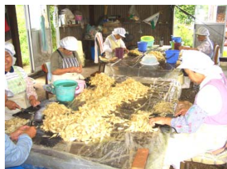
②当社OBや定年退職後の方による手作業