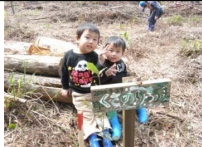
当社社員や家族も草刈りなどの作業に参加します!