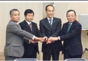
知事・高原町長との調印式