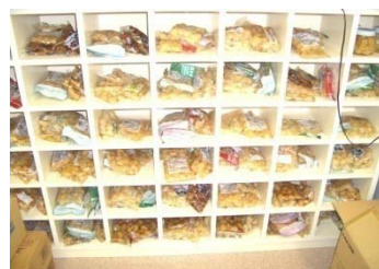
⑦賞味期限まで保管し、異常が無いチェックを行う