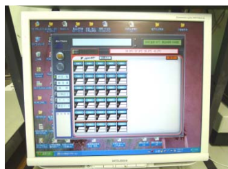
⑥袋詰め後もロット細菌検査を行い、パソコン管理する