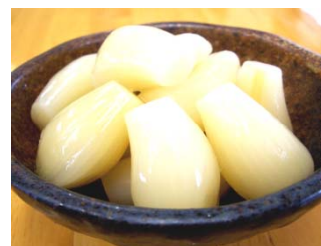
⑧手間と厳重な検査を経て、安心して安全な商品の完成