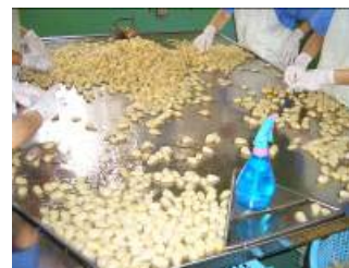
④一粒一粒検品を行う