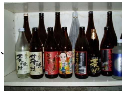
「ひむか寿」ほか主力商品

農畜産会社「チアフルカウズ」を立ち上げ、300頭余りに焼酎粕を未処理のまま与えて飼育している。肉質が向上すると共に、廃棄するしかなかった焼酎粕の有効活用につながっている。