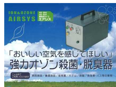
「強力オゾン殺菌・脱臭器」

宮崎県産オビスギ材の乾燥凝縮液を有効活用した製品の開発研究事業への参画、保育園などの砂場での利用を目的とした「抗菌砂」の開発など多数。