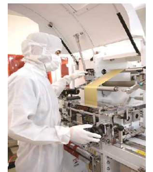
精密なスリット加工