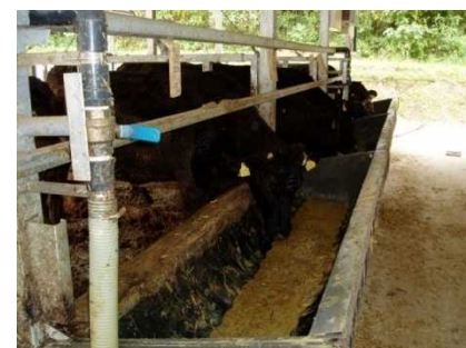
焼酎粕で育つ肉用牛