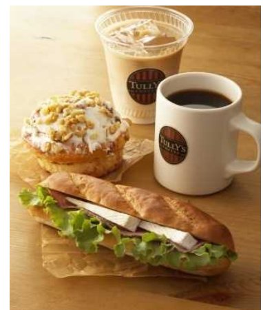
香り高いコーヒーと 豊富なサイドメニュー