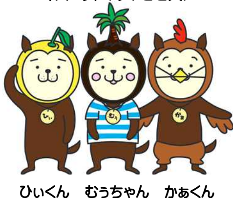
マスコット(みやざき犬)