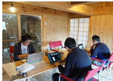
古民家を改修したワーケーション施設（椎葉村）