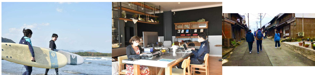
実証事業の様子（日向市）