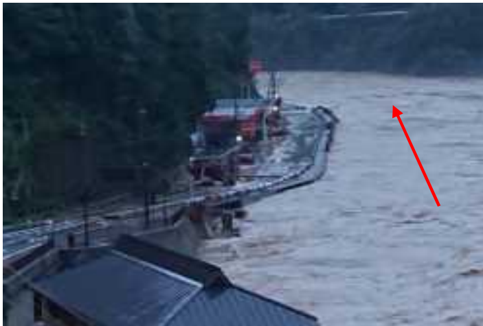
耳川・浸水被害(諸塚村)