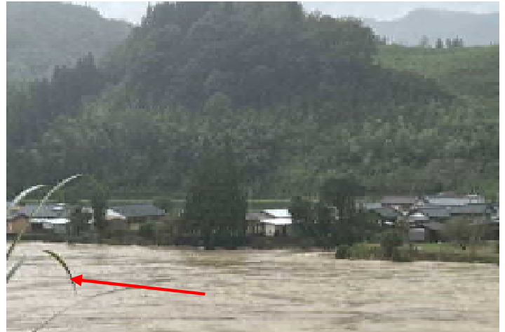
耳川・浸水被害(美郷町)