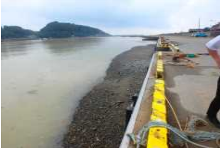
美々津港・土砂堆積（日向市）