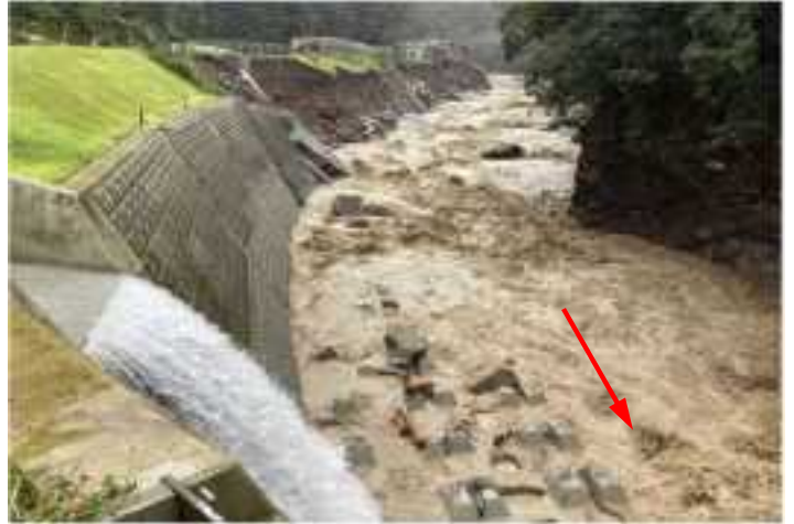
銀鏡川・護岸決壊(西都市)