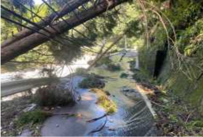
県道諸塚高千穂線(諸塚村)