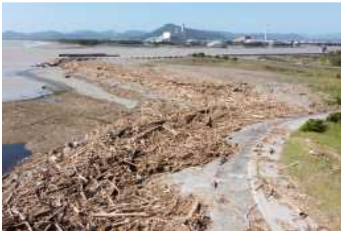
延岡港海岸・流木被害（延岡市）