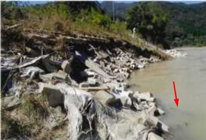
北川・護岸決壊 (延岡市)