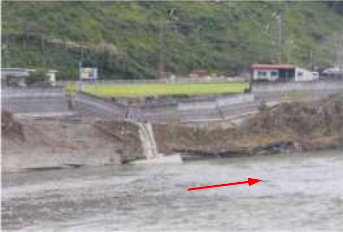
大淀川・護岸決壊(宮崎市)