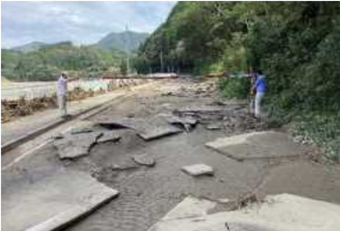
県道八重原延岡線(日向市)