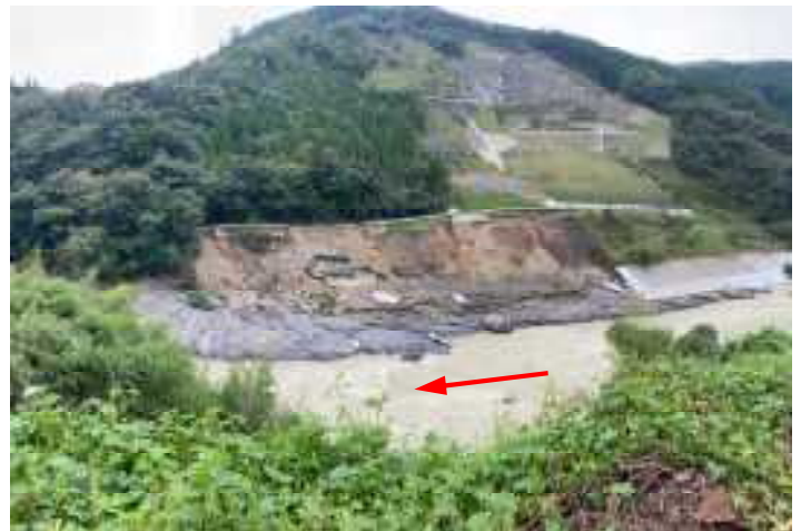
耳川・護岸決壊(美郷町)