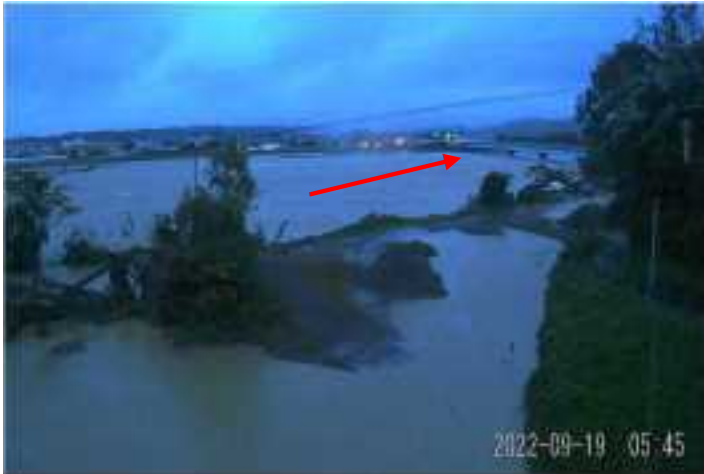
一ツ瀬川・浸水被害(西都市)