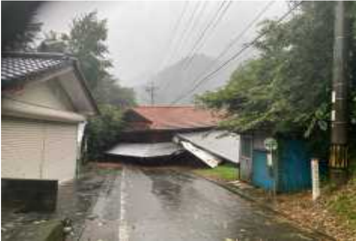
岩井谷地区・がけ崩れ(高千穂町)