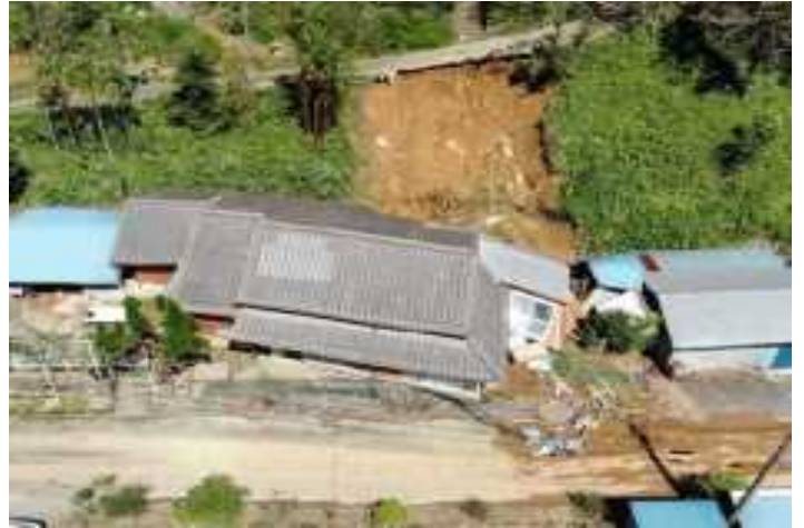
下渡川地区・がけ崩れ(日向市)