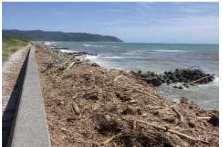
平山海岸・流木被害（日南市）