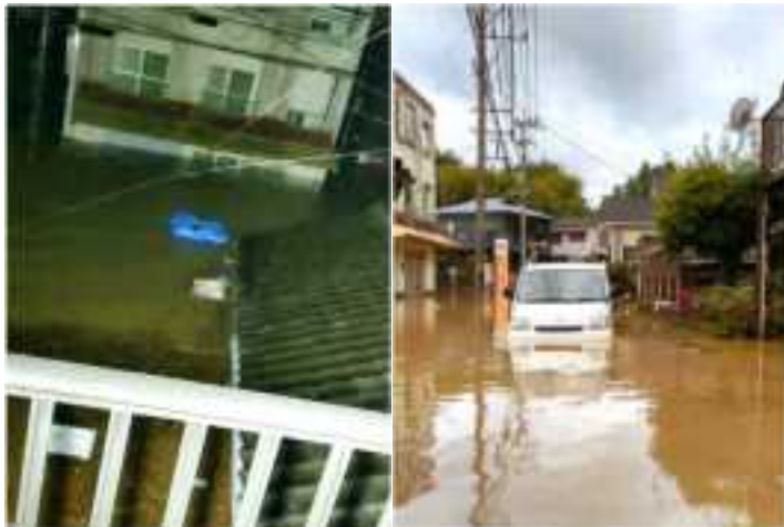
曾木川・浸水被害(延岡市)