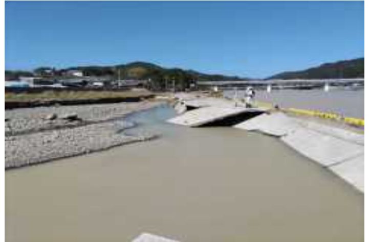
美々津港・物揚場被災（日向市）