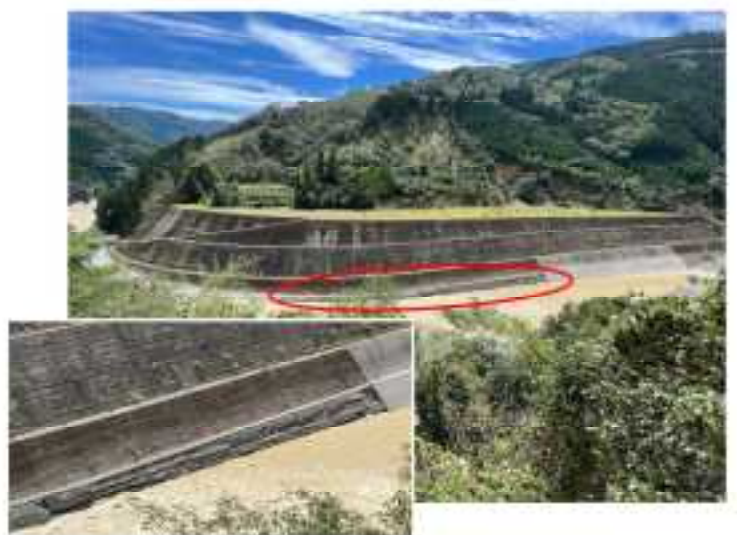
島戸地区・護岸決壊(美郷町)