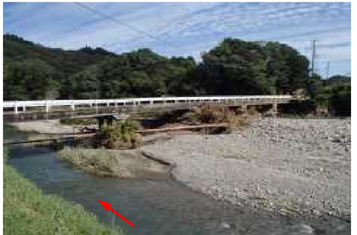
曾木川・土砂堆積(延岡市)