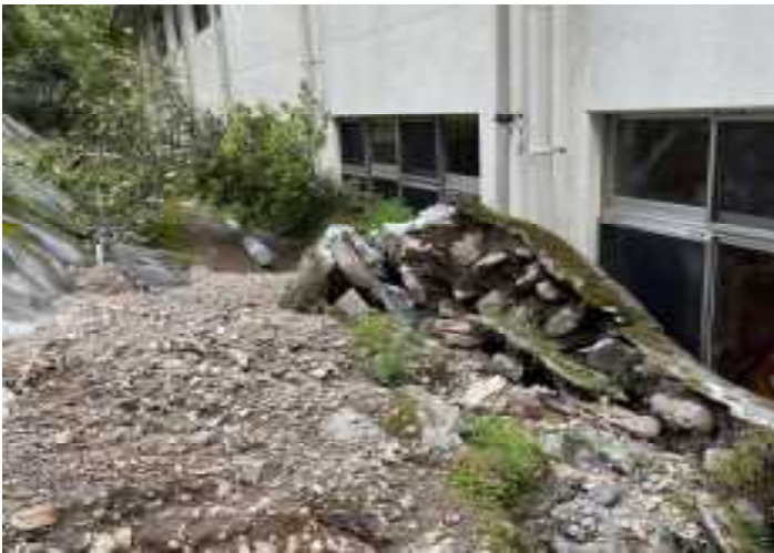
野々首地区・がけ崩れ(椎葉村)