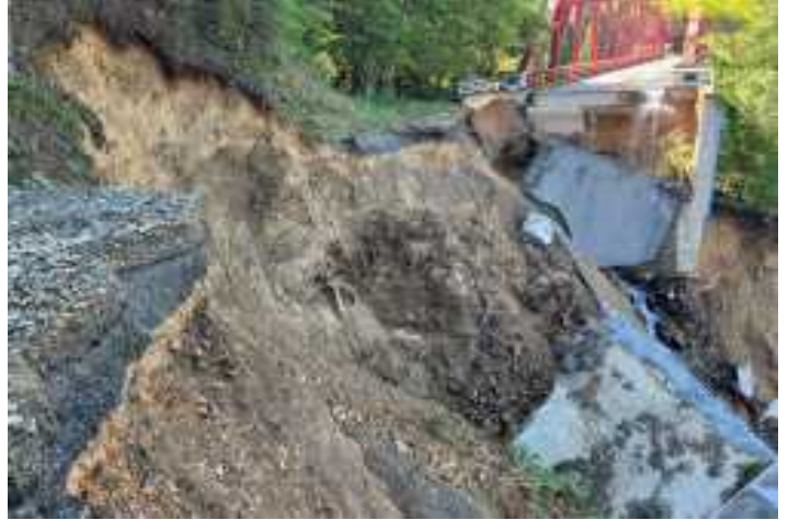
県道上椎葉湯前線(椎葉村)