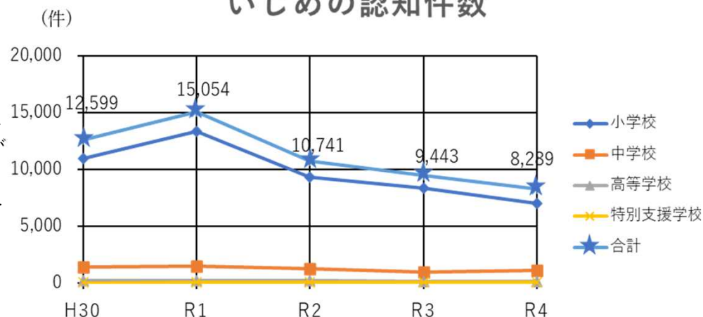
いじめの認知件数

※R4の本県公立学校児童生徒1,000人あたりの認知件数は76.6件（全国国公立：53.3件）