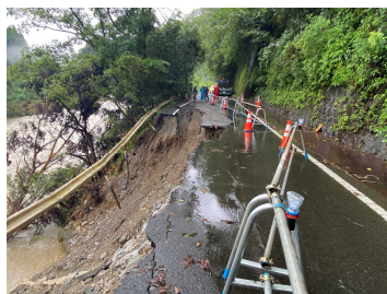
北方高千穂線（日之影町）