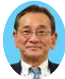
副委員長 わたなべ まさたけ 渡辺 正剛 宮崎県議会自由民主党 東諸県郡選出