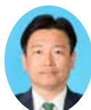
委員 ふたみ やすゆき 二見 康之 宮崎県議会自由民主党 都城市選出