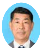
副委員長 くろいわ やすお 黒岩 保雄 宮崎県議会自由民主党 日南市選出