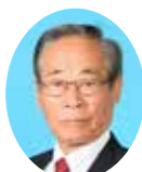
委員 やました ひろみ 山下 博三 宮崎県議会自由民主党 都城市選出