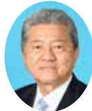
委員 とやま まもる 外山 衛 宮崎県議会自由民主党 日南市選出