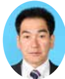
委員 あらがみ みのり 荒神 稔 宮崎県議会自由民主党 都城市選出