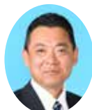
委員 ひだか ひろゆき 日高 博之 宮崎県議会自由民主党 日向市選出