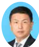
委員 さかもと やすろう 坂本 康郎 公明党宮崎県議団 宮崎市選出