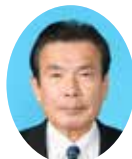
委員 はまな まもる 濱砂 守 宮崎県議会自由民主党 西都市・西米良村選出