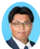
委員 やまうち いっとく 山内いっとく 宮崎県議会自由民主党 都城市選出