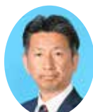
副委員長 さいとう りょうま 齊藤 了介 宮崎県議会自由民主党 宮崎市選出