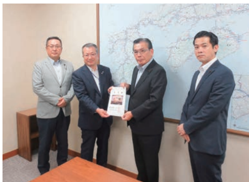
【西日本高速道路株式会社への要望】 後藤常務執行役員(左から2人目)へ手交