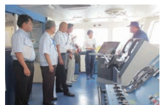
宮崎海洋高等学校(宮崎市)

県内調査 新たに建造された宮崎海洋高等学校の実習船「進洋丸」(宮崎市)、学校と連携した部活動の地域移行の実践(小林市)、日向警察署の女性専用留置施設(日向市)、AI等の新技術を活用しスマート保安実証実験を行う猿瀬発電所(高岡町)など、計10件の現地調査を行いました。