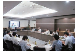
Uターン者の雇用等の調査（小林市）

県内調査 移住・定住の促進や子育て支援の取組について三股町役場を訪問したほか、企業のUターン者の雇用や地域貢献の取組（小林市）、経済の地域内循環の取組（西米良村）、住民ドライバーによる高齢者の移動手段確保の取組（西都市）など、官民の人口減少対策や地域活性化の取組について現地調査を行いました。