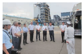
木質バイオマス発電の視察(都城市)

県内調査 磯平地区治山事業(宮崎市)、肉用牛定休型ヘルパー事業(都城市)、木質バイオマス発電を行っている企業、火山活動による河川の水質悪化への対応を行っている硫黄山水質改善施設(えびの市)、新規就農者確保の取組(高千穂町)など、計10件の現地調査を行いました。