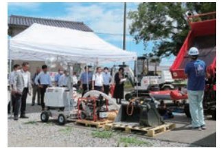
日向市役所（日向市）

県内調査 B&G財団からの助成を活用した防災倉庫の設置や防災人材の育成の取組について日向市役所を訪問したほか、台風14号災害からの復旧状況（椎葉村）、防災に係る学校での取組（門川町）、災害発生時の要支援者に対する避難誘導（延岡市）など、各所の防災減災の取組について現地調査を行いました。