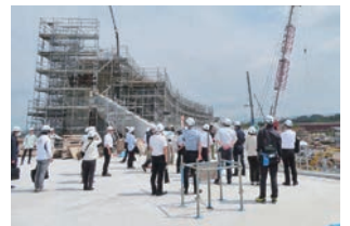
新宮崎県陸上競技場(都城市)

県内調査 みやざきフードビジネス相談ステーションを活用した工場新設等の取組(宮崎市)、「特定事業協同組合」による地域活性化の取組(日南市)、国スポ・障スポ施設(新宮崎県体育館・陸上競技場)建設現場(延岡市・都城市)、県消防学校訓練施設見学・初任科生との意見交換など、計10件の現地調査を行いました。