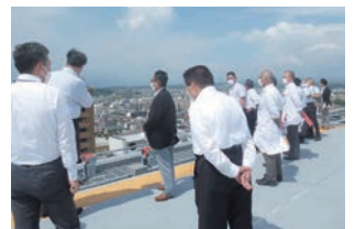
県立宮崎病院ヘリポート(宮崎市)

県内調査 障がい者の就業支援における取組(日向市)、成年後見制度や権利譲渡支援に係る取組(延岡市)、食品衛生に係る取組(都城市)、県立宮崎病院の再整備(宮崎市)、子ども食堂やフードバンク事業における意見交換(宮崎市)など、計10件の現地調査を行いました。