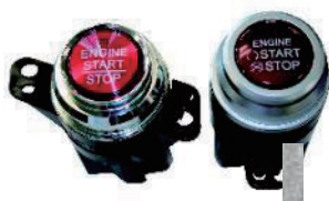
スタート ストップ SW