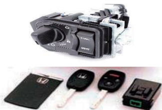
ステアリングロックASSY (イモビシステム)