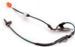
ABSホイールセンサー