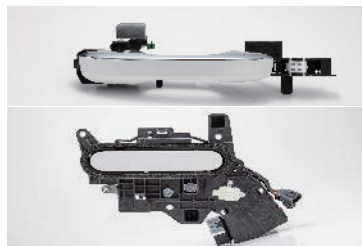
アウトサイドドアハンドル