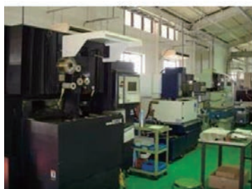
ワイヤー放電加工機