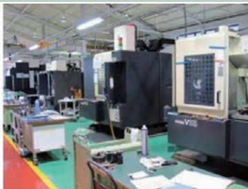
マシニングセンター