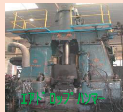
エアドロップハンマー