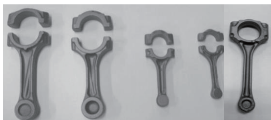
コンロッド (自動車エンジン部品)