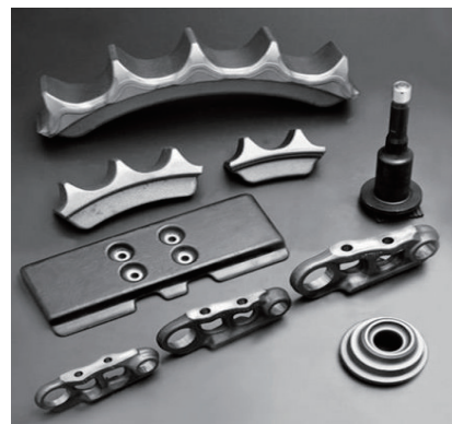
建設機械 足回り部品