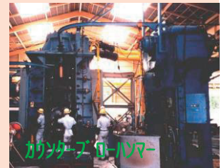
カウンターブローハンマー