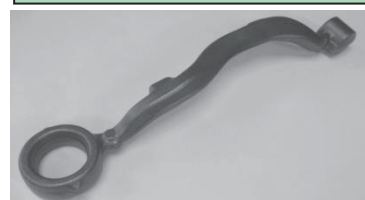
アームサスペンション (自動車足回り部品)