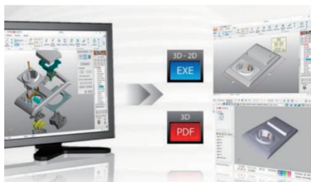
設計・開発部門新設しました