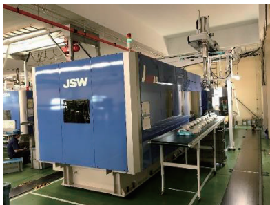
大型樹脂成形機電動650トン