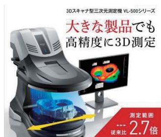
最新鋭三次元測定機導入しました!