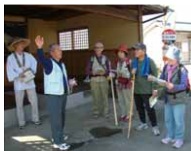
高千穂町浅ヶ部では、八十八ヶ所めぐりのウォーキングを実施。地元の方がガイドとして活躍