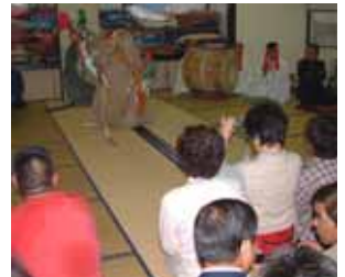
岩戸神楽が披露されました。