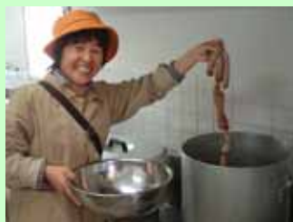
最後に、70～80度のお湯で、約30分間ボイルしてできあがり。フライパンで焼いてもOK