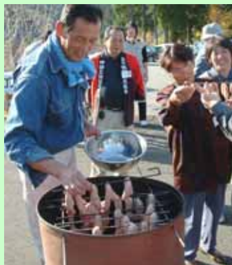
広葉樹のサクラヤクスギを使って、燻製にします。