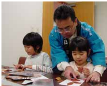
落葉を使った森のしおり作り