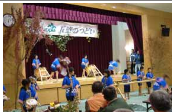
坂本小学校の生徒による「荒踊」

地元の自然や文化を体感する「森のセミナー」とフォレストピア圏域の食材を使った料理や民謡、郷土芸能等を披露する「交流の夕べ」が行われ、交流を深めました。