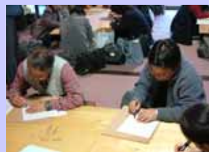
えりもの切り体験