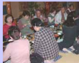
「やまめの里」での昼食