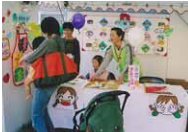
「高千穂町子育て支援センター」の紹介コーナー

地域の子育て支援関係者として、西臼杵地区からは「高千穂町子育て支援センター」と「日之影町子育て支援実行委員会」が参加し、日頃の活動などを発表しました。