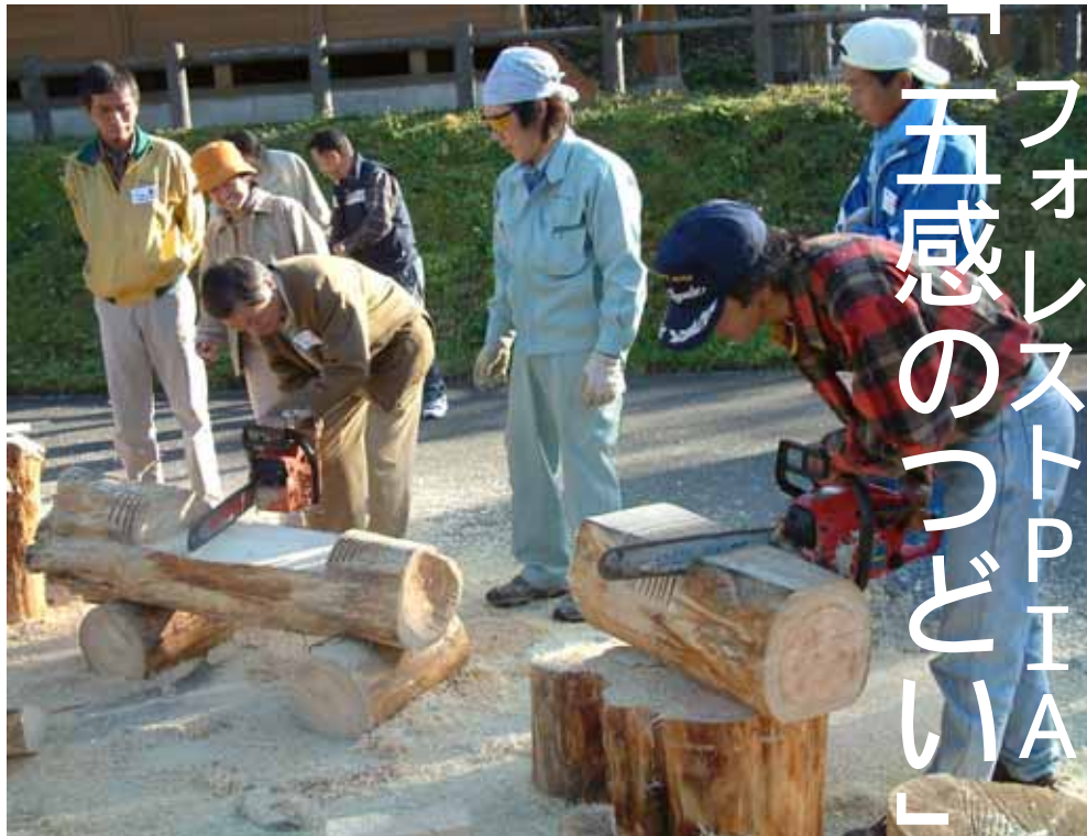
チェーンソーを使って彫刻や椅子を作製するチェーンソーアート