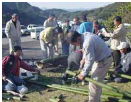
カッポ酒の容器となる竹カッポ作り