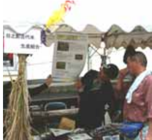
日之影古代米生産組合のコーナー