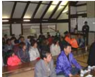
県境を越えて交流を深めた緒方・高千穂わかぞう一揆

地域の活性化はもとより、県道緒方高千穂線の早期改良の促進を願って実施されています。