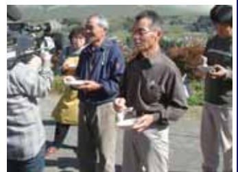
地鶏とブロイラーの食べ比べを行った地元の方々