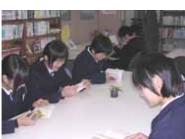
読書にいそしむ上野中学校の生徒

上野中学校は、平成9年度から学校で年間4千冊の読破を目標に読書活動に取り組んでおり、平成14年度には、年間図書貸出数がついに4,080冊に達しました。