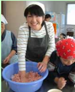
挽肉に調味料を入れてかき混ぜます。