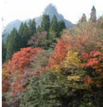
五ヶ瀬町鞍岡の冠嶽。紅葉がきれいでした。