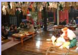
夜神楽を鑑賞しながら夕食（神楽の館）