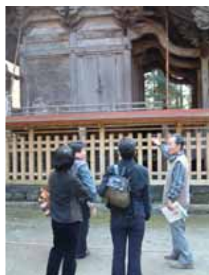
五ヶ瀬町の歴史散策。その他、力ヌー、やまめ料理と白滝、四季の御膳、木工体験、釜炒茶教室の体験メニューを準備。