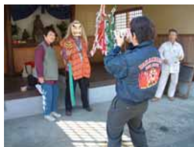
夜神楽の手力雄のお面を付けて記念撮影