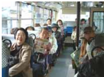
無料周遊バスの車内