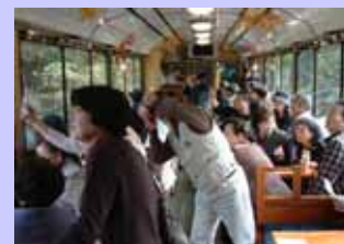
高千穂鉄道「トロッコ列車」