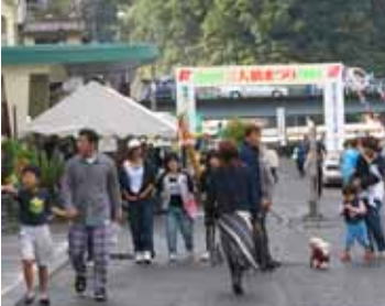
大勢の来場者で賑わった会場

会場では、芸能発表大会や地元の特産品の展示・即売コーナーも多数出展し、大勢の来場者で賑わいました。