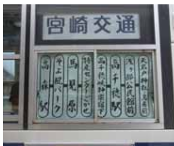
バスの行き先案内板

「南阿蘇&高千穂地域観光・交流協議会」（南阿蘇と西臼杵の町村、観光協会、県、交通機関等で組織。事務局高千穂町）は、国土交通省の支援を受けて、十一月六日（土）〜七日（日）に、高森町と高千穂町間の無料周遊バスを運行しました。約六百名が利用し、利用者からは大変好評でした。この事業は、南阿蘇鉄道と高千穂鉄道を結ぶ交通機関の検討を目的に実施されたもので、この間の沿線の新たな地域資源の発掘として、いろいろな試みが行われました。熊本県と宮崎県の県境を越えた連携事業であり、今後のきっかけづくりとなりました。