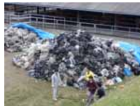
J A家畜市場に集められた廃プラスチック

宮崎県は全国に先駆けてデポジット制度を採用し、農業用プラスチック資材代金にあらかじめ処理料が上乘せられて販売されています。年明けに再度回収を行う予定です。