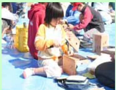
親子で巣箱づくり

また、来年5月15日に高千穂町で開催される「第59回愛鳥週間全国野鳥保護のつどい」のPRもかねて、「巣箱づくり」も行われました。