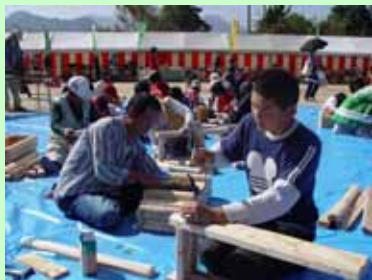
プランターづくりを楽しむ参加者

会場では、地域の林業後継者で組織している「西臼杵地区林業研究グループ連絡協議会」による「プランターづくり」や「樹木当てクイズ」等が行われたほか、特設ステージでは、丸太切り競争やチェーンソーアート、せんぐまき、お楽しみ抽選会なども行われました。