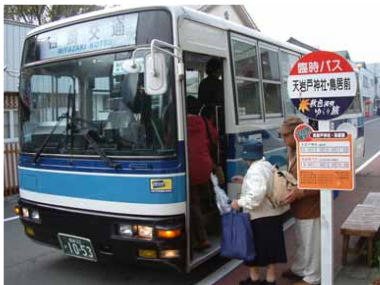
無料周遊バスに乗り込む利用者。この事業のためのバス停も設置