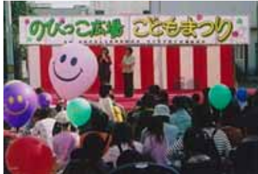
「のびっこ広場」で発表する「日之影町子育て支援実行委員会」

子育てキャラバン隊は、子育てに不安感や負担感を感じることが多い乳幼児のお母さんと地域の子育てサークルなどとの出会いの場を創り、子育てに関する相談の機会や情報を提供するために行われました。