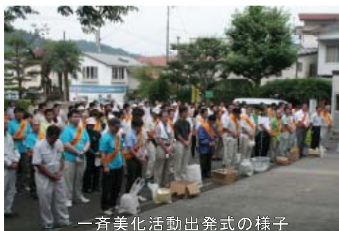
一斉美化活動出発式の様子

こうした活動を通して、河川や道路の役割を再確認し、大切に利用する「 愛護の心 」を広げていただきたいと思います。