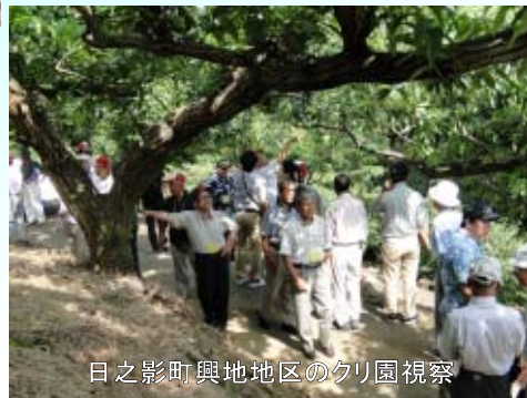
日之影町興地地区のクリ園視察