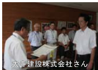
大寺建設株式会社さん

今後とも他の模範となるような、素晴らしい工事が期待されるところです。受賞されたみなさま 本当におめでとうございました！