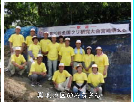
興地地区のみなさん