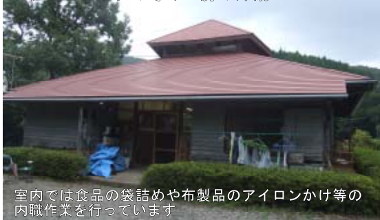
室内では食品の袋詰めや布製品のアイロンかけ等の内職作業を行っています