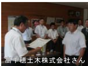
高千穂土木株式会社さん