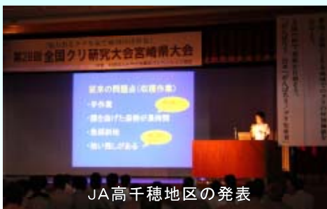
JA高千穂地区の発表