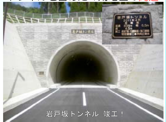
岩戸坂トンネル 竣工!

協議会会長は、あいさつの中で、「トンネルを含めた4期地区の 開通 を 地域住民は大変喜んでいる 。下野集落と岩戸集落が近くなったことで 互いに交流し共に発展していきたい 。今後は全線開通となる5期地区の早期の完成を望んでいます。」と開通を喜んでおられました。