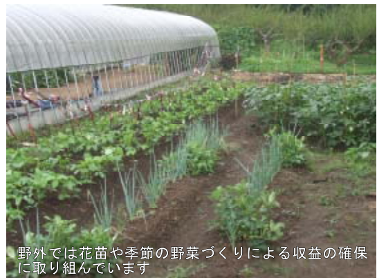
野外では花苗や季節の野菜づくりによる収益の確保に取り組んでいます