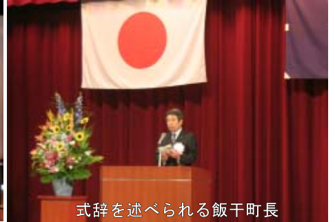
式辞を述べられる飯干町長