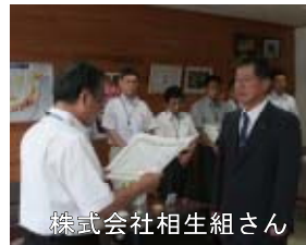
株式会社相生組さん