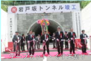
テープカット・くず玉割り

広域農道西臼杵地区は、日之影町深角（国道218号）から高千穂町板屋（県道土生高千穂線）までの約16.1kmを整備するもので、今回の「岩戸坂トンネル」の完成で 全体の9割にあたる約14.7kmが開通 しました。