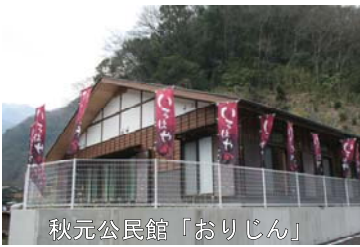
秋元公民館「おりじん」