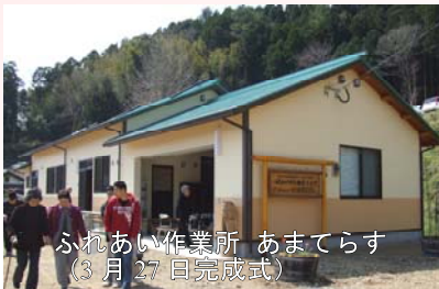
ふれあい作業所 あまてらす (3月27日完成式)