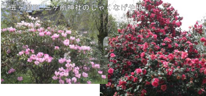
五ヶ瀬町 三ヶ所神社のしゃくなげや椿