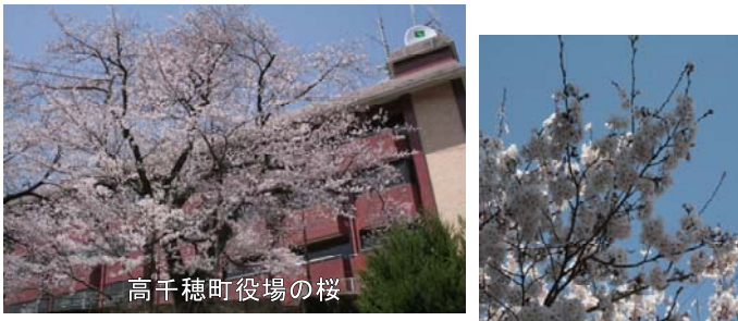
高千穂町役場の桜