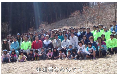
参加者のみなさん