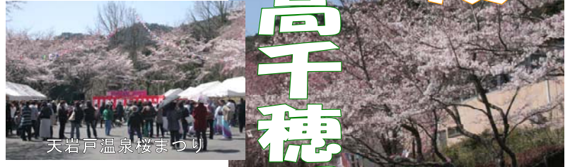
天岩戸温泉桜まつり