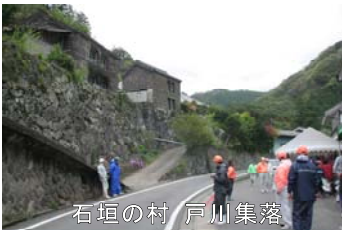
石垣の村 戸川集落