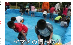
ヤマメの掴み取り