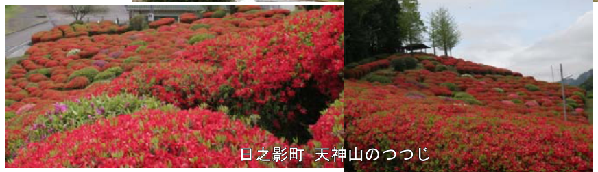
日之影町 天神山のつつじ

暖かい春を迎え、高千穂郷のここかしこに 花の便り が届きました。開花のタイミングはまちまちですが、多くの花々が見頃を迎え、咲き誇り、それらを眺める私たちの心を浮き立たせます。