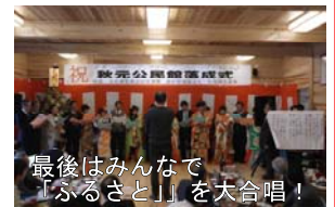
最後はみんなで「ふるさと」を大合唱！

また、祝賀会では、 とても楽しい出し物の数々が披露 され、祝いの席を大いに盛り上げました。