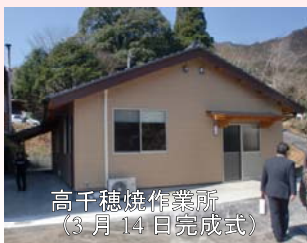
高千穂焼作業所 (3月14日完成式)

今後は、充実した作業環境の中で、障がいがある方の自立した生活に向けた一層の支援が期待されます。