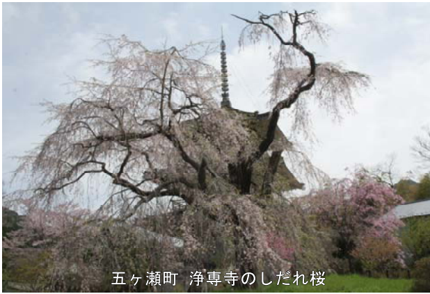
五ヶ瀬町 浄専寺のしだれ桜