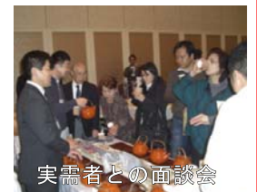
実需者との面談会