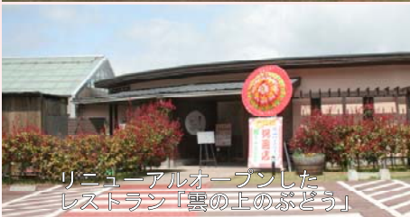
リニューアルオープンしたレストラン「雲の上のぶどう」

この施設は、県単独事業の「みんなでつくるいきいきふるさと事業」を活用して五ヶ瀬町が建設したもので、五ヶ瀬産の県産材をふんだんに使用するなど、県産材の需要拡大にも貢献いただきました。竣工祝賀会のこの日、施設名が「風のホール」と命名され、今後、町や地元主催の各種イベントのメイン会場として利用される他、地元の農産物や特産品を販売・PRする場として利用される予定です。