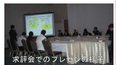
求評会でのプレゼンの様子

これまでこのような会に参加する機会が少なかったため、会員のみなさんも 大変刺激を受けられた ようでした。