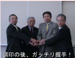
調印の後、ガッチリ握手！

五ヶ瀬町は、平成22年4月の口蹄疫発生時に消毒ポイントを山都町側に設置した際、山都町より水の供給等で協力を得るなど連携をとってきていますが、今回の協定締結により、県境における防疫体制の更なる強化が図られます。