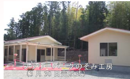
フラワーパークのぞみ工房 (3月30日完成式)