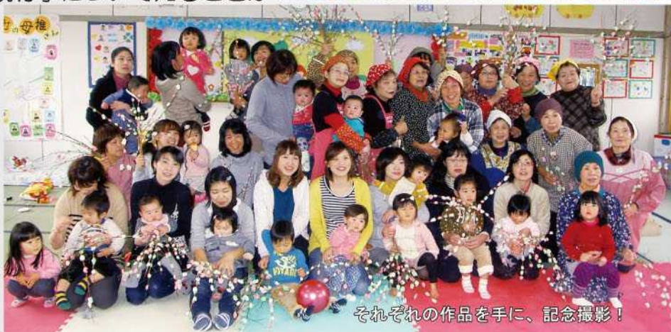
それぞれの作品を手に、記念撮影！