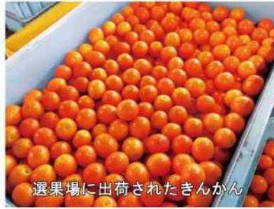
選果場に出荷されたきんかん

今年は小玉傾向ではありますが、例年よりも糖度が高く、酸味も少ないため、食味は良好に仕上がっています。3月末まで出荷が続きますので、皆さん是非ご賞味下さい！