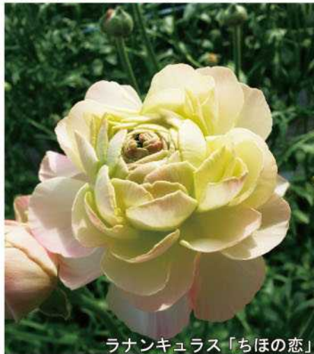
ラナンキュラス「ちほの恋」