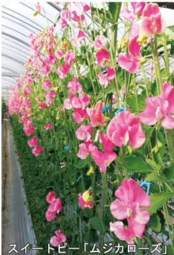
スイートピー「ムジカローズ」