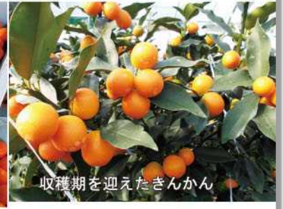
収穫期を迎えたきんかん