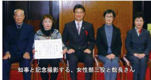
知事と記念撮影する、女性部三役と館長さん

動支援事業を実施しています。本組公民館女性部の皆さんのように、美しい川づくりに参加してみませんか？詳しくは県のホームページに掲載しています。興味のある方は、ぜひ御覧ください。