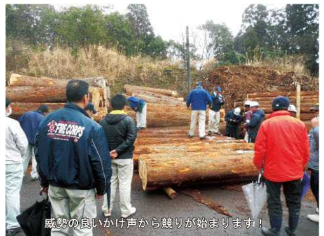
威勢の良いかけ声から競りが始まります！

今後もこのような取引価格が続き、本年が林業・木材業界の飛躍の年となることを願っています。