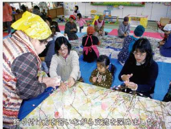
飾り付け方を習いながら交流を深めました。

参加した保護者からは「初めて参加したが、皆さんと会話してふれあいながら、伝統行事について知ることができて良かった。」「子どもも遊び感覚で参加でき、楽しそうにしていたので良かった。」等の感想をいただきました。体験後には、高千穂町産のもち米や小豆を使ったぜんざいの振る舞いもあり、親子仲良く楽しい時間を過ごされていました。体験をとおして親子で伝統行事や食育・地産地消活動の大切さを実感する良い機会になったようです。