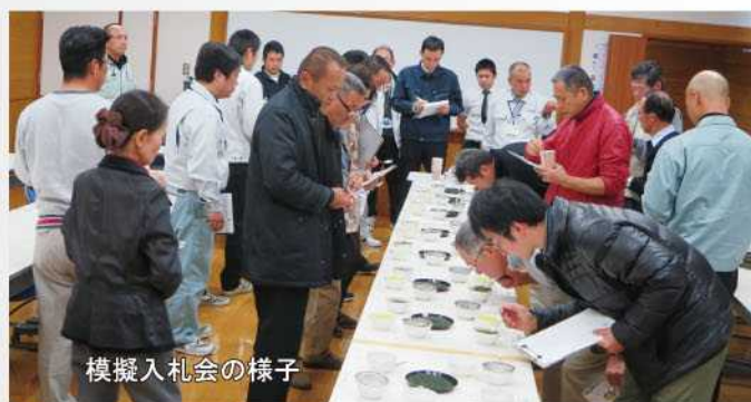
模擬入札会の様子

参加した生産者からは、「購買者に好まれる荒茶の特徴がわかった。来年度の一番茶からはそのようなお茶を製造して出荷したい。」といった感想が聞かれ、有意義な求評会となりました。