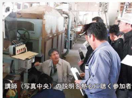
講師（写真中央）の説明を熱心に聴く参加者

今回の研修は、日頃の機械メンテナンスの重要性を再認識するとともに、来年度本県で開催される全国茶品評会での上位入賞に向けても貴重な研修となりました。