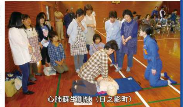
心肺蘇生訓練（日之影町）