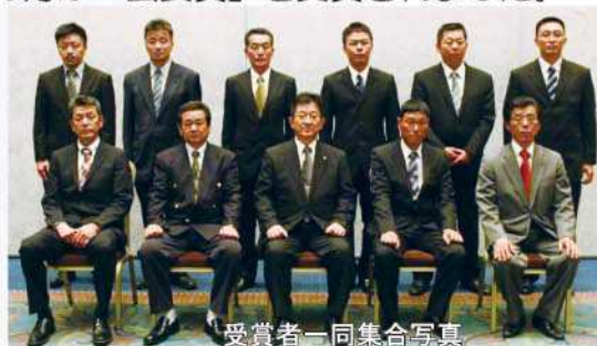
受賞者一同集合写真

さらに、6月5日には、宮崎県森林組合連合会第64回通常総会において、西臼杵森林組合が、県森連林産物流通センター(原木市場)における取引量が県内8つの森林組合の中で最も多かったことから、事業実績表彰「一般材」の部で「最優秀賞」に選ばれました。