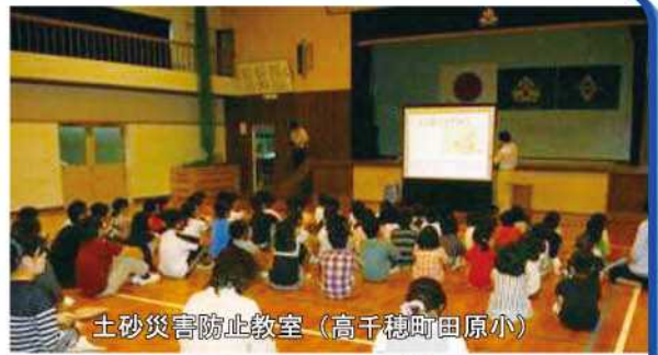
土砂災害防止教室（高千穂町田原小）

これから本格的な雨のシーズンに突入します。引き続き、防災意識のさらなる普及を図るため、啓発活動に努めていきます。