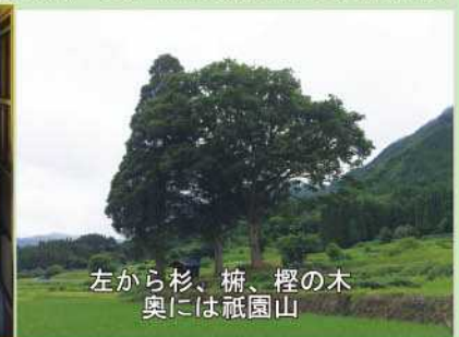
左から杉、楠、檜の木 奥には祇園山

*西臼杵支庁の業務等について、ご意見、ご要望などありましたら下記までご連絡ください。