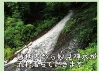
敷地内から妙見神水が流れ落ちていきます