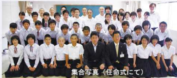
集合写真(任命式にて)

五ヶ瀬町の三ヶ所中学校と鞍岡中学校では、平成23年度から修学旅行時に、ごかせ観光協会の協力のもと、東京都板橋区のハッピーロード大山商店街で五ヶ瀬町のPR活動を行っています。今年も、両校の2年生(計42人)の皆さんが、五ヶ瀬町の観光特使に任命され、6月23日に同商店街で、ごかせ観光協会とともにPRを行いました。商店街では、生徒さんが手摘みした釜炒り茶等の特産品を販売したり、手作りのパンフレットを配布するとともに、棒術、なぎなた、団七踊りの郷土芸能を披露し、都民の皆さんに存分に五ヶ瀬町をPRしました。