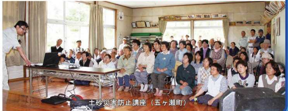
土砂災害防止講座（五ヶ瀬町）