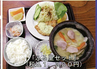
「ふる里セット」 (税込1,300円)

さて、おすすめの料理は「宮崎牛焼き肉定食」。宮崎牛がふんだんに使われており、ソースがよく合い、ご飯が進みます。牛丼や牛肉うどん・そばにも宮崎牛が使われています。その他チキン南蛮とだご汁(夏は冷や汁)という宮崎名物を一度に味わえる「ふる里セット」や定食メニューも充実していますので、ぜひ一度ご賞味ください。