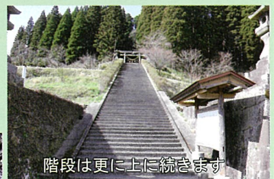
階段は更に上に続きます