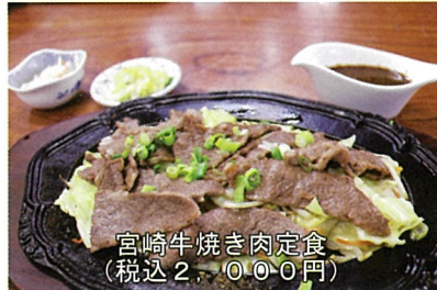
宮崎牛焼き肉定食 (税込2,000円)

今回は、日之影町の「レストラン雲海橋」を紹介します。高千穂町と日之影町の町境にある国道218号雲海橋の日之影町側のたもとにお店があります。雲海橋から見える峡谷や高千穂鉄橋は絶景です！