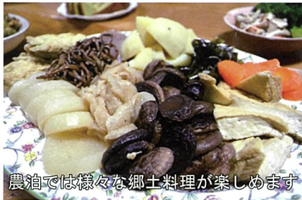
農泊では様々な郷土料理が楽しめます

そして、五ヶ瀬ワイナリーといえば、町産ぶどうを100%使用して作られた「五ヶ瀬ワイン」ですが、今年もみずみずしさあふれるフルーティーな仕上がりとなっています。ぜひ試飲をしながらお好みのワインをお買い求めください。その後は、ワイナリーの「雲の上のぶどう」で五ヶ瀬町産の旬な食材を使った料理をお楽しみください。