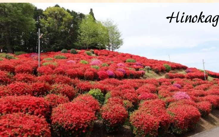
天神山つつじ公園