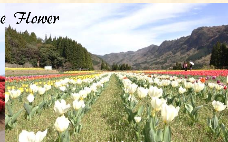
中川のチューリップ