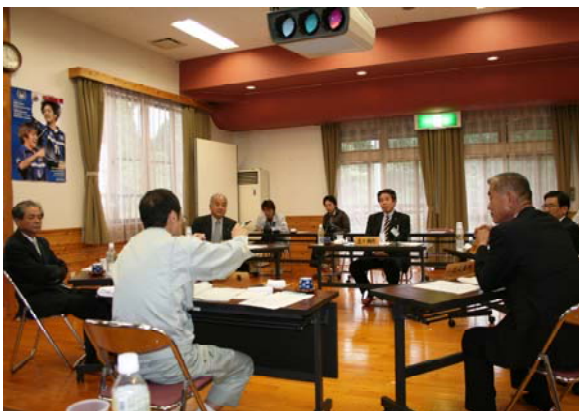
知事と意見交換を行う5町村長