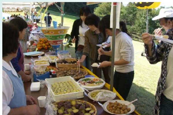
地元の食材を使って作られたお芋料理の試食