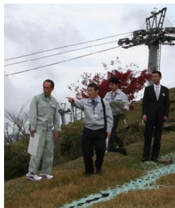
五ヶ瀬ハイランドスキー場を視察する知事