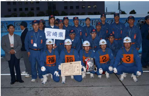
全国大会で優良賞を受賞した日之影町消防団第3分団12部の皆さん

東京ビッグサイトで開催された第21回全国消防操法大会において、本県代表として出場した日之影町消防団第3分団12部が小型ポンプの部で9位優良賞を受賞しました。