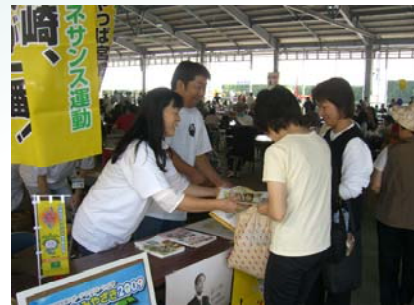
バランスガイドの配付