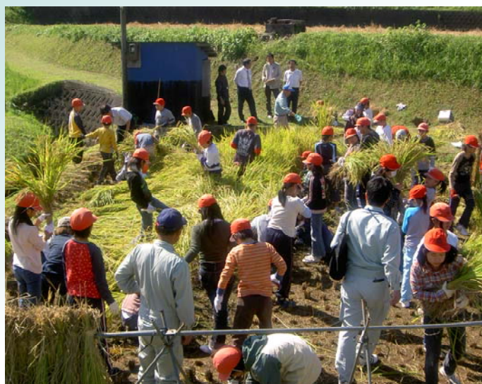
積極的に稲刈りに取り組む子供たち