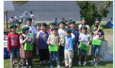
三ヶ所小学校みどりの少年団による「森林づくり誓いのことば」と緑の募金活動