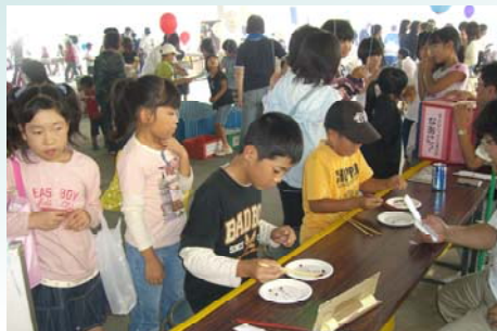
食育ゲーム（まめ移動）