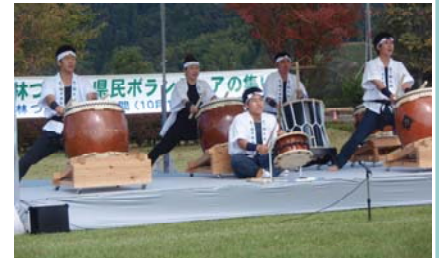
五ヶ瀬中等教育学校「鼓魂（こだま）」による五ヶ瀬太鼓の演奏