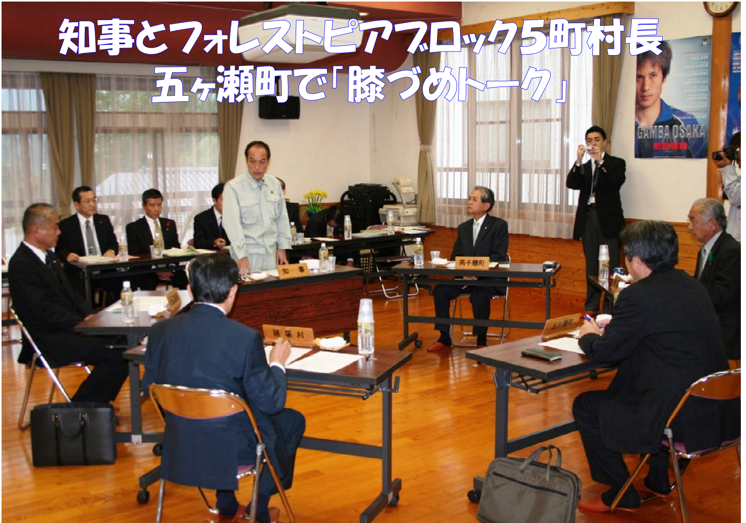
知事とフォレストピアブロックの5町村長が地域の諸問題について意見交換を行うチーム宮崎「膝づめトーク」(五ヶ瀬町森林交流館)