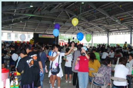
大勢の人で賑わう会場

JA高千穂地区青年部主催の「みさとわくわく市」が家畜市場にて開催されました。地元小学校吹奏楽部の演奏やエイサーなどの催し物、スポーツ少年団対抗の玉入れ大会など楽しいイベントがあり、会場は大勢の人で賑わいました。また、各地区JA青年部・女性部・SAPなどの屋台が出店され大盛況でした。みやざきの食と農を考える県民会議西臼杵支部も、食育推進の一環として食育体験ゲームやバランスガイドの配付を行いました。