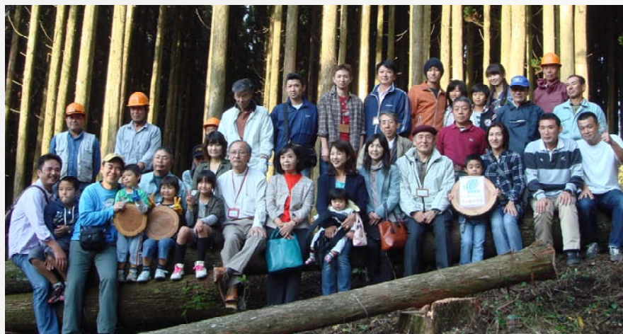
福岡県から参加した10家族32名の皆さん

このツアーがスタートして4年目を迎えますが、今回初めてSGEC認証森林である日之影町下小原共有林で開催することになり、伐採現場や(株)もくみでの製材工程を見学しました。参加者は、実際に自宅ですわれる木材が、素晴らしい環境で育ち、加工される様子を見ることができ、安心したようです。