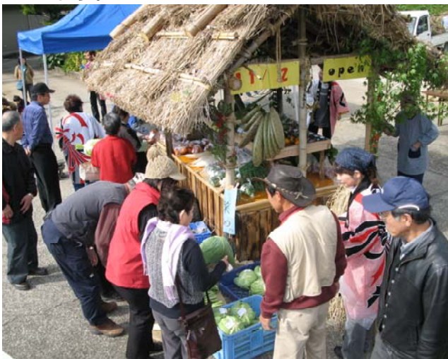
観光客などのお客で賑わいました