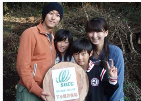
消費者にとっては、環境に優しい木材であることを識別するためのツールとなる「SGEC認証マーク」