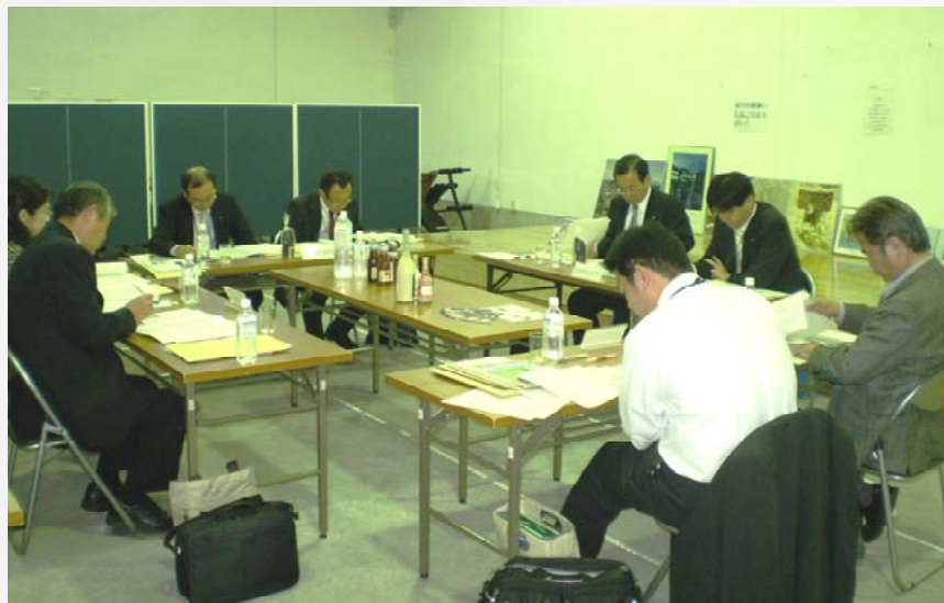
広域観光施策等について積極的な意見交換を行いました(長湯歴史温泉伝承館「万象の湯」)