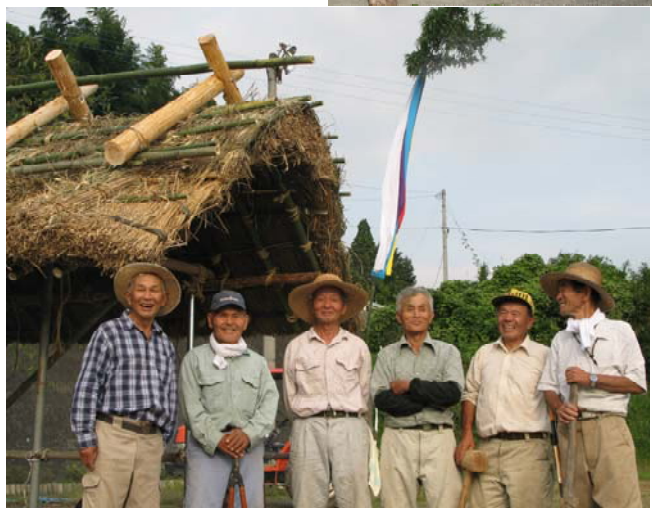
かやぶき屋根を担当した老人クラブ「普請組」の皆さん