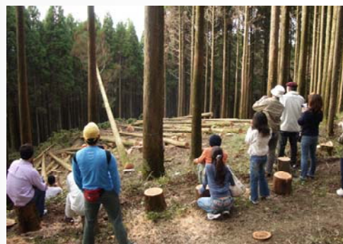
伐採現場の迫力に皆さんビックリの様子