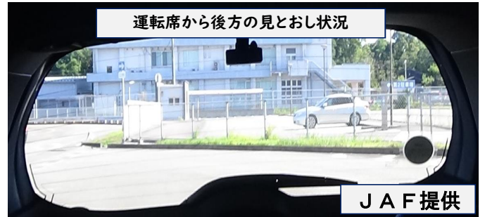
運転席から後方の見とおし状況