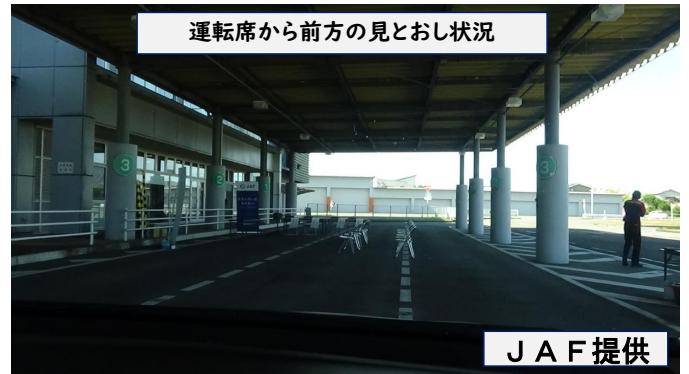
運転席から前方の見とおし状況