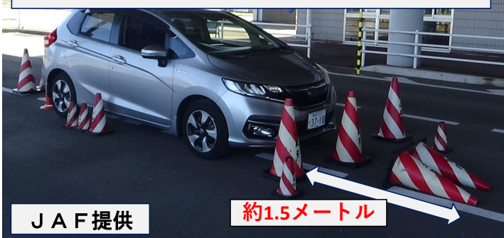
運転席に座った場合の前方の死角（カラーコーンは死角の範囲）

車の種類によって、死角の範囲は変化しますが、私たちが思っている以上に運転席からの死角は広範囲となっています。