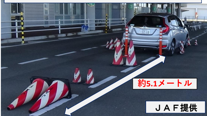
運転席に座った場合の後方の死角（カラーコーンは死角の範囲）