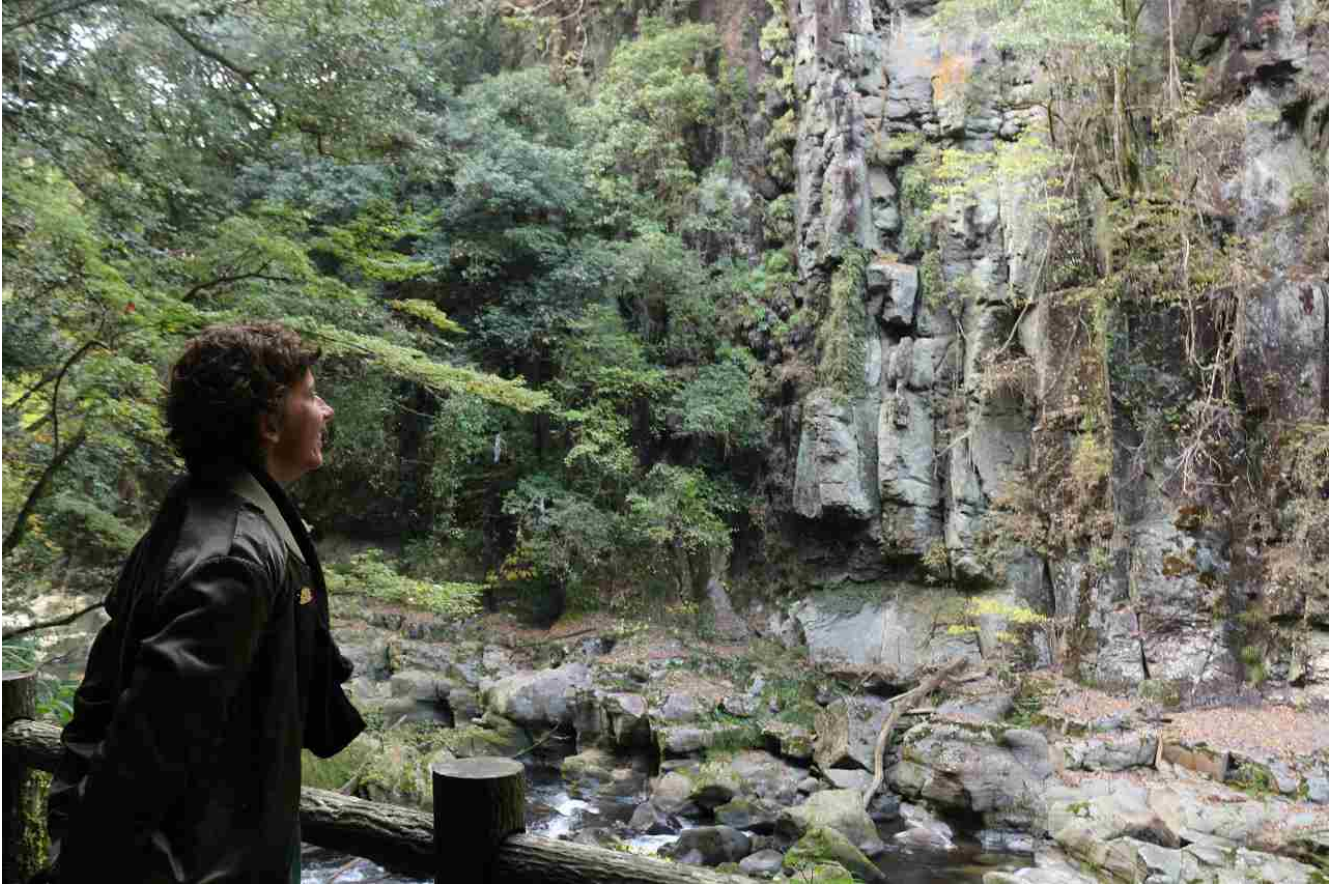
三之宮峡の屏風岩。高さ32m、幅60mもある。

ロレーヌさんお気に入りの三之宮峡へやってきた。三之宮峡は霧島ジオパークを体感できるジオサイトのひとつ。霧島山の噴火によってつくられた渓谷で、屏風岩や千畳岩などの豪快な奇岩が見どころ。かつて木材を運び出したトロッコ道は遊歩道として整備され、11もある手掘りのトンネルが当時の様子を物語る。