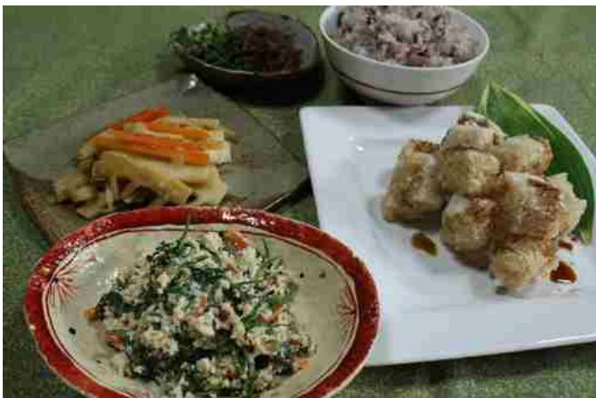
日本の家庭料理を家族と一緒に作れるのも、農家民泊の醍醐味。

さらに、旅の途中でも体を動かしたくなる特徴もあるという。問い合わせがあると、「もしよかったら登山しましょう」と提案。大浪池や韓国岳、高千穂峰への登山は、大好評。「頂上で食べるカップラーメンに、淹れたてのコーヒー、下山したら白鳥温泉に浸かって…」と、日本人の楽しみ方と似ている部分も。ただ、雨の日なかなか大変なのとか。庸山窯での絵付け体験や神社めぐりなどを組み合わせる。