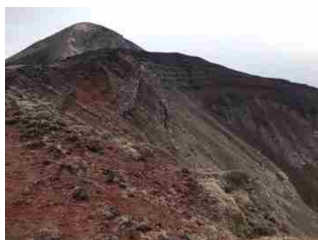
高千穂峰の馬の背。自然に圧倒される。