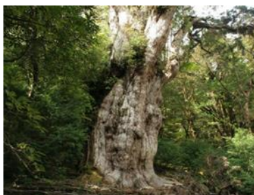
屋久島・口永良部島