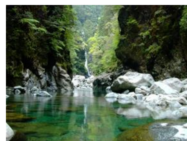
大台ヶ原・大峯山・大杉谷

主 催：日本ユネスコエコパークネットワーク 後 援：日本ユネスコ国内委員会、日本MAB計画支援委員会 日 程：令和6年7月17日（水）～18日（木） 会 場：エンシティホテル延岡（宮崎県延岡市）