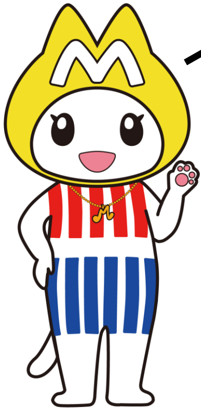
宮崎市制100周年記念 キャラクター「みやねこ」