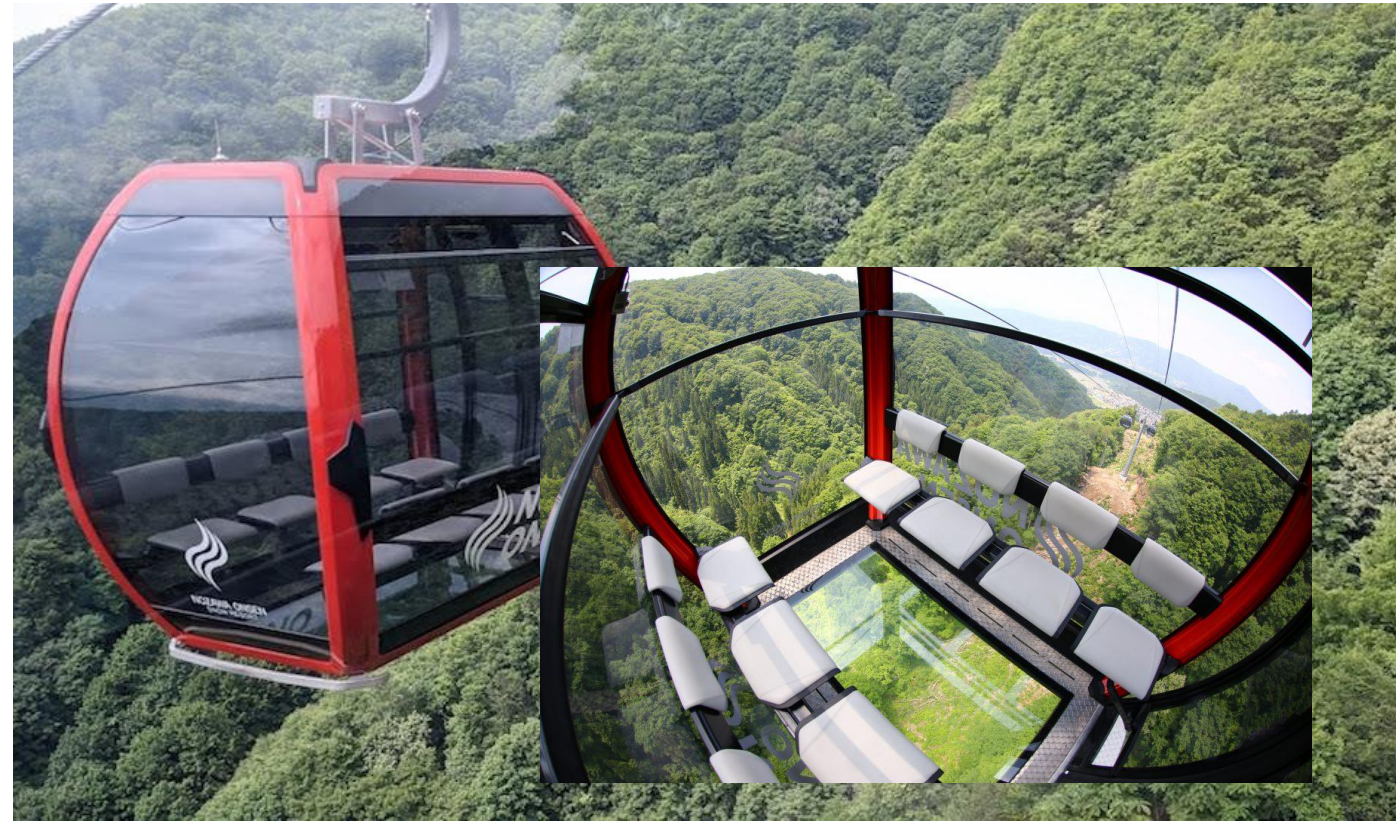
ゴンドラタイプのリフト