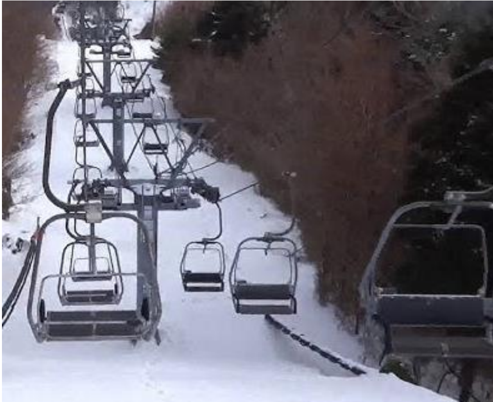
五ヶ瀬の入場リフト