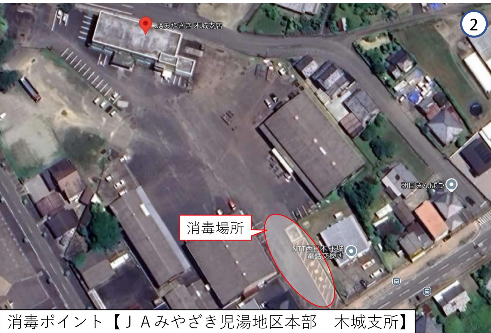
消毒ポイント【JAみやざき児湯地区本部 木城支所】