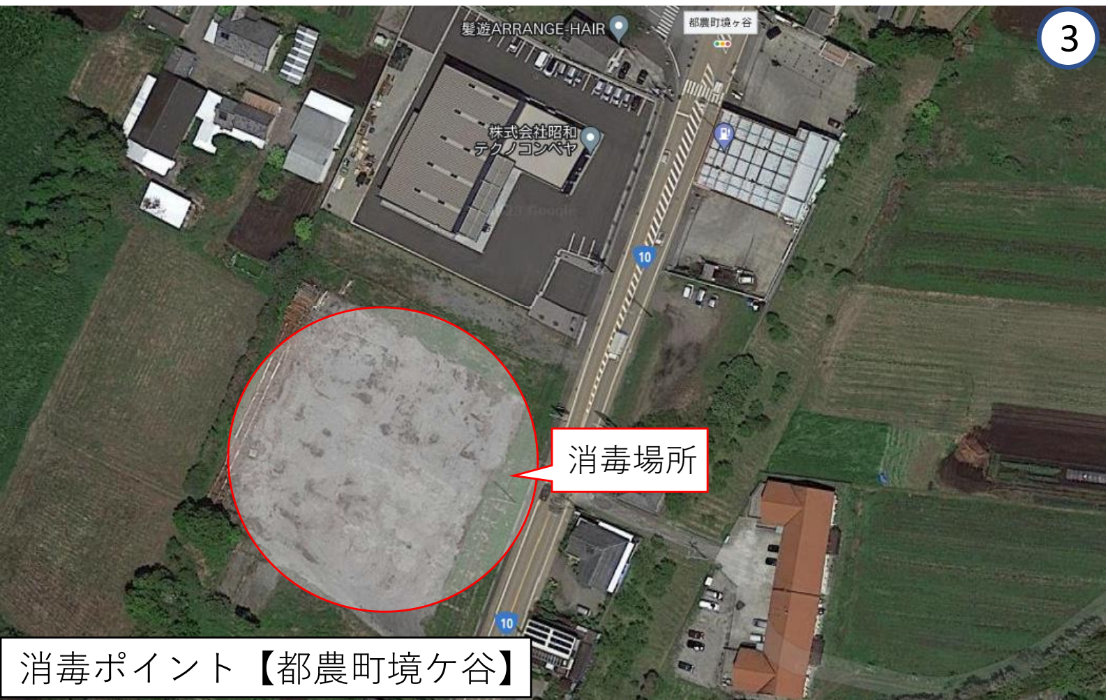
消毒ポイント【都農町境ヶ谷】