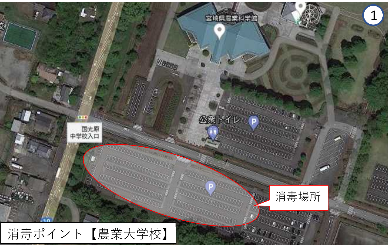
消毒ポイント【農業大 schools】