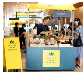
ルミネアグリマルシェ開催イメージ

「ルミネ」が運営する NEWoMan 新宿において、みやざきの新鮮な農産物や加工品を首都圏の消費者に届ける取組です。本県と首都圏をつなぐ架け橋として、県内で生産された野菜、果物、花、特産品などを販売し、県産品の魅力を直接体感できる場を提供します。