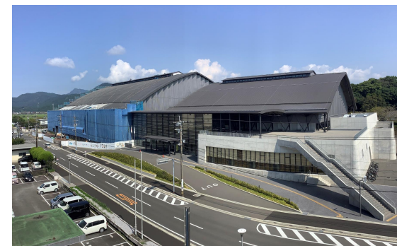
外部 令和7年8月撮影