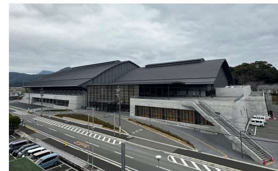
外部 令和8年2月撮影