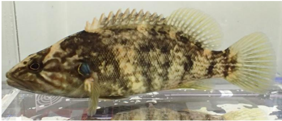
コウライオヤニラミ