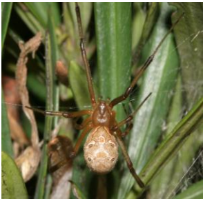
ハイイロゴケグモ