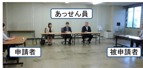
あっせんのイメージ

公・労・使委員の三者から構成される「あっせん員」が当事者双方の言い分をお聞きして、問題点を整理のうえ、助言を行い、合意点を探りながら歩み寄りを勧め、「あっせん案」（解決案）を提示するなどして、話し合いによる円満な解決をお手伝いします。