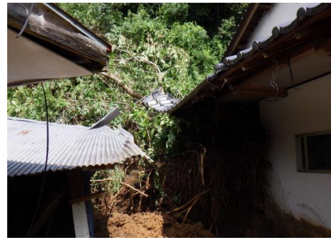
8/10 にしうすきぐん たかちほちよう おぎりはた 西白杵郡高千穂町鬼切畑 がけ崩れ