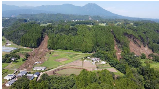
8/10 にしもろかたぐんたかはるちようたけやしき 西諸県郡高原町竹屋敷 がけ崩れ