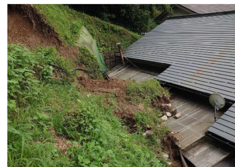
8/10 にしうすきぐん たかちほちよう みやおの 西白杵郡高千穂町宮尾野(1)-2 がけ崩れ