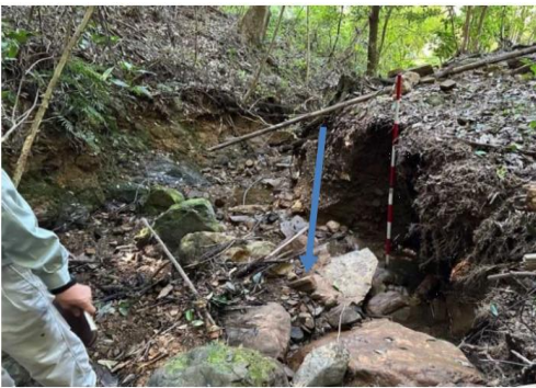
8/10 ひゅうがし とうごうちよう くいはるたにかわ 日向市東郷町久居原谷川3 土石流