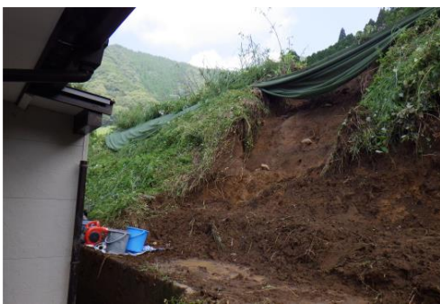
8/10 にしうすきぐん たかちほちよう こうやびら 西白杵郡高千穂町高野平 がけ崩れ