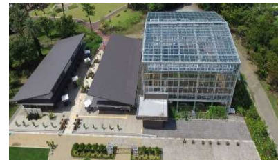
▲宮崎ボタニックガーデン青島