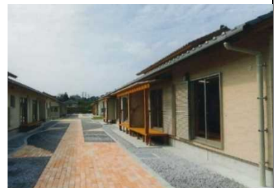
▶県営ひかりヶ丘C団地 (木造、子育て世帯向け)