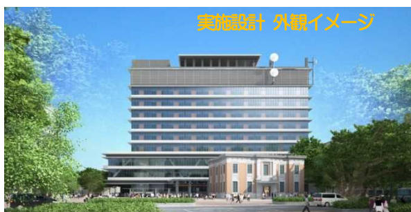
<県防災拠点庁舎整備計画>