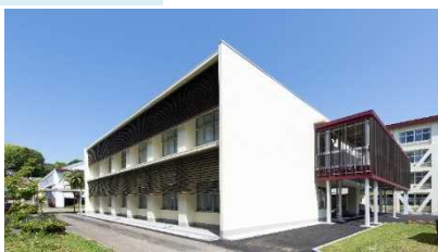
▲県立妻高等学校再編整備

庁舎や県立学校などの県有建物の新築、増改築、改修等に関連する調査や設計、工事監理等を行っています。