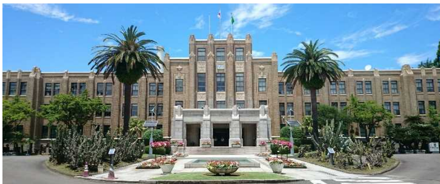
宮崎県庁本館 (1932年竣工)