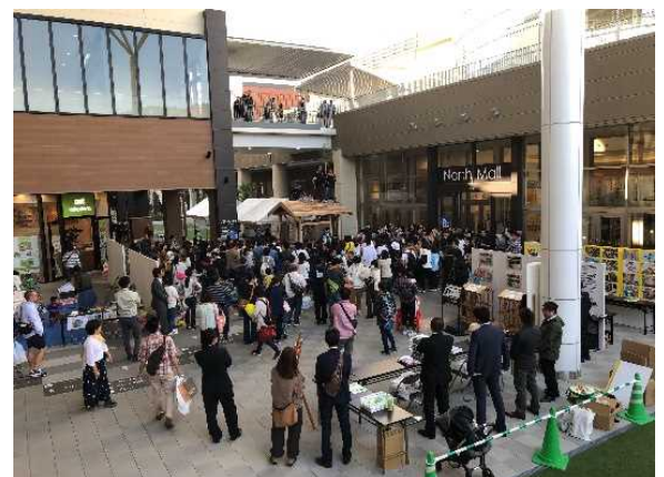
▲住情報イベント「住まい・る・メッセ」

宮崎県内には約 9,000 戸の県営住宅があり、「宮崎県営住宅長寿命化計画」により、老朽化した住宅の建替や、既存住宅のバリアフリー化、子育て世帯向け住宅整備など、安全・安心な住宅の整備を行っています。