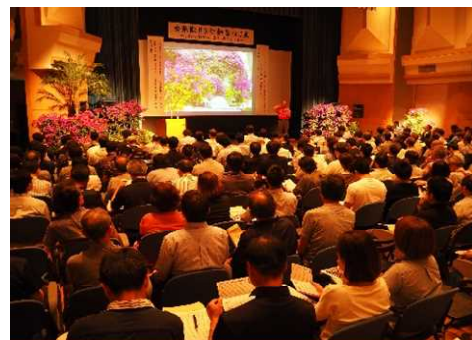
▲研修会「美しい宮崎づくりのつどい」

自然環境と共生する都市の実現を目指して、広域的観点から都市づくりの基本的な方針となる都市計画区域マスタープランを策定するとともに、市町村とともに将来の都市の姿を描いています。