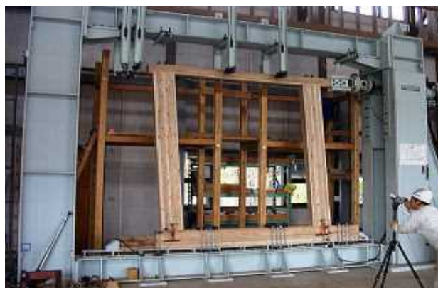
▲構造試験機木構造相談室

また、一般住宅の構法開発や性能評価の取り組み、スギ材の特徴を活かした新たな接合部や耐力壁の提案を行っています。