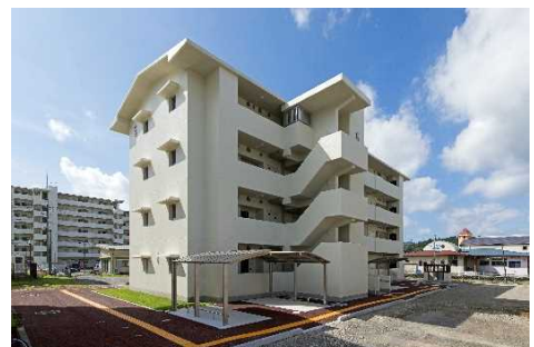
▲県営馬越団地 (学童保育施設併設団地)