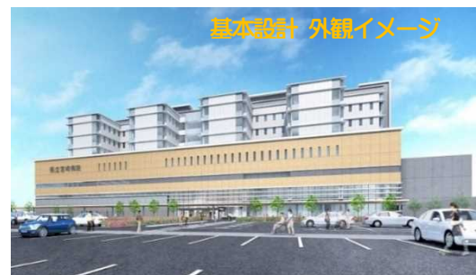
<県立宮崎病院改築計画>