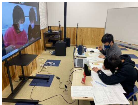
○椎葉村内の中学生の参加・・・中学校3年生5名(⑮のみ中学校1年生2名も参加)