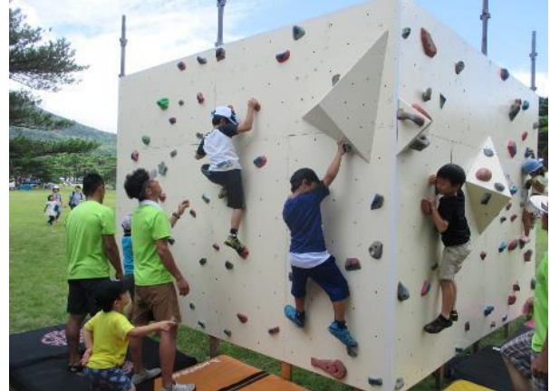
8月11日／えびの市 えびの高原 山の日イベント 「霧島山モンテフェス」を開催