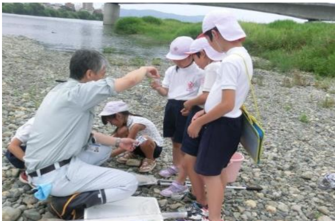
通年／県内各地 (54回実施) 小中学生を対象に、本県独自の「五感 を使った水辺環境指標」を用いた水辺 環境調査を実施