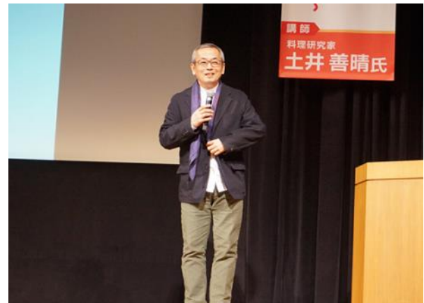
2月2日／宮崎市 宮崎市民プラザ 「食べきり宣言フォーラム」を開催 料理研究家 土井善晴氏による講演、 食べきり川柳コンテスト表彰式など を実施