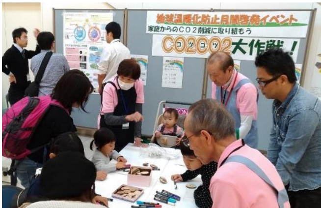
12月1日／宮崎市 イオンモール宮崎 家庭からのCO2削減に取り組むため 「地球温暖化防止月間啓発イベント」 を開催 (木のバッジ作りの様子)