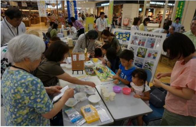
6月24日／宮崎市 イオンモール宮崎 環境保全に関する普及啓発イベント 「みやざきエコフェスティバル」を開催 (紫外線発色ビーズストラップ作成の様子)