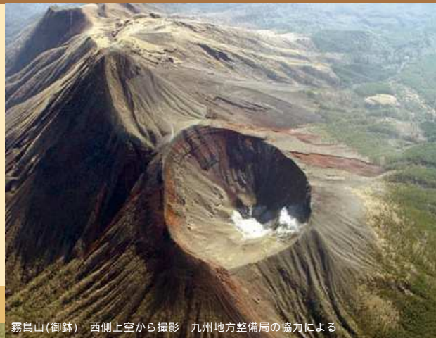
霧島山(御鉢) 西側上空から撮影 九州地方整備局の協力による

各レベルには、火山の周辺住民、観光客、登山者等のとるべき防災行動が一目で分かるキーワードを設定しています（レベル5は「避難」、レベル4は「避難準備」、レベル3は「入山規制」、レベル2は「火口周辺規制」、レベル1は「活火山であることに留意」）。対象となる火山が噴火警戒レベルのどの段階にあるかは、噴火警報等でお伝えします。