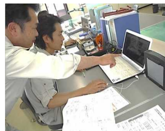
【先輩社員からの指導の様子】

現在メンター制度を採用入れ、特に新入社員に対してのフォローを人事部門が手厚く行っています。