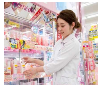
【カウンセリング接客の様子】