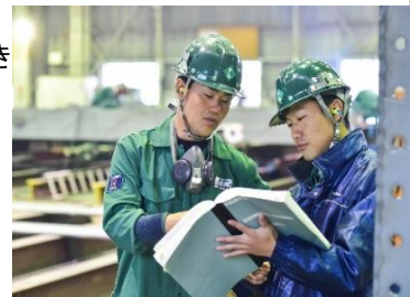
【チームで協力しながら仕事をします】