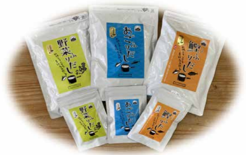
宮崎県産椎茸を使用した料理だし