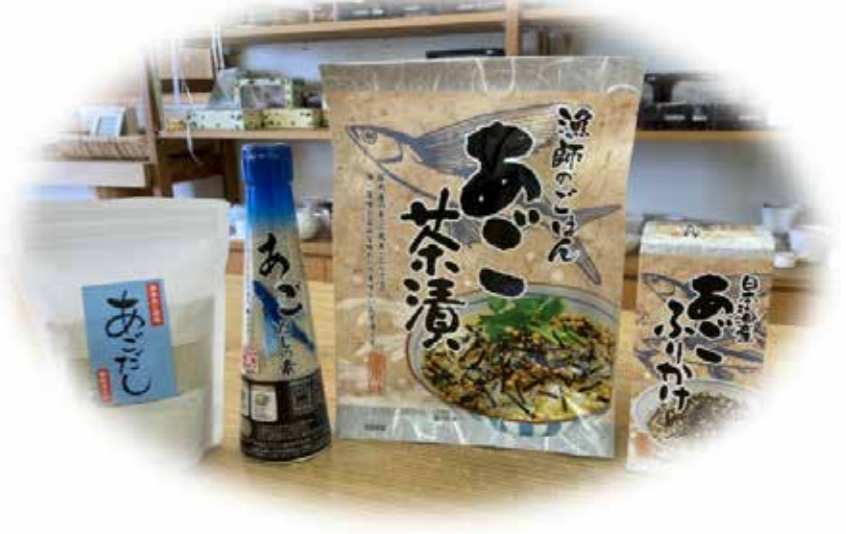
粉末化したあご(飛魚)を使用した商品