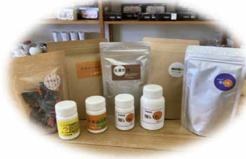
県産原料を使用した 健康食品