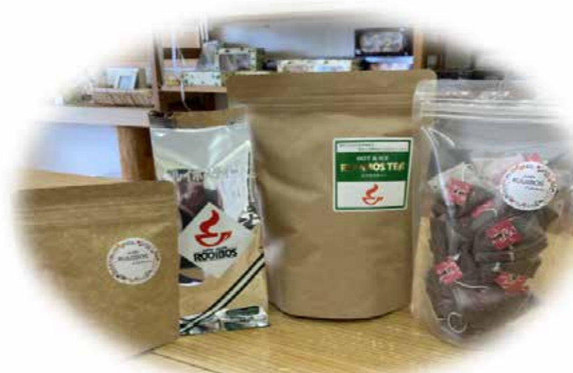
遠赤焙煎したルイボスティー