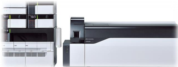
高速液体クロマトグラフ質量分析計