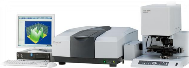
赤外顕微異物解析システム