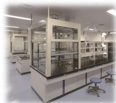
実験台・ドラフト導入例