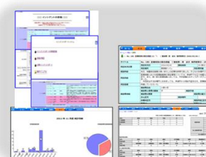
医療安全パッケージツール