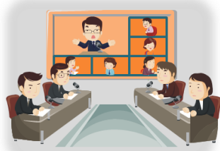
TV会議/Web会議システム