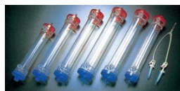
人工腎臓透析容器