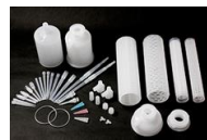
濾過フィルター部品